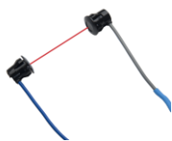
ГОЛОВКА ДАТЧИКА HP, от 2 до 5 м Две головки датчика для моделей HP1 и HP2 с кабелем длиной 5 м