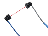
ГОЛОВКА ДАТЧИКА HP, от 2 до 8 м Две головки датчика для моделей HP1 и HP2 с кабелем длиной 8 м